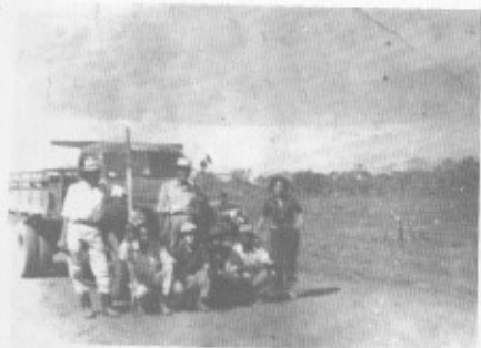
Asa Sul 30 de outubro de 1957