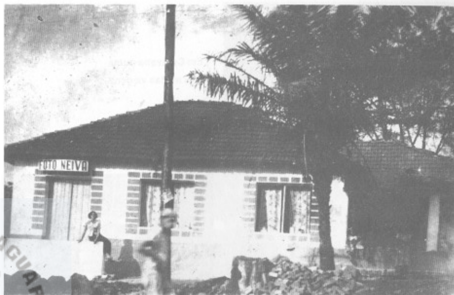
Um dos muitos aspectos de sua luta pelos caminhos da vida física. - CERES-GO - DEZ. - 1949.