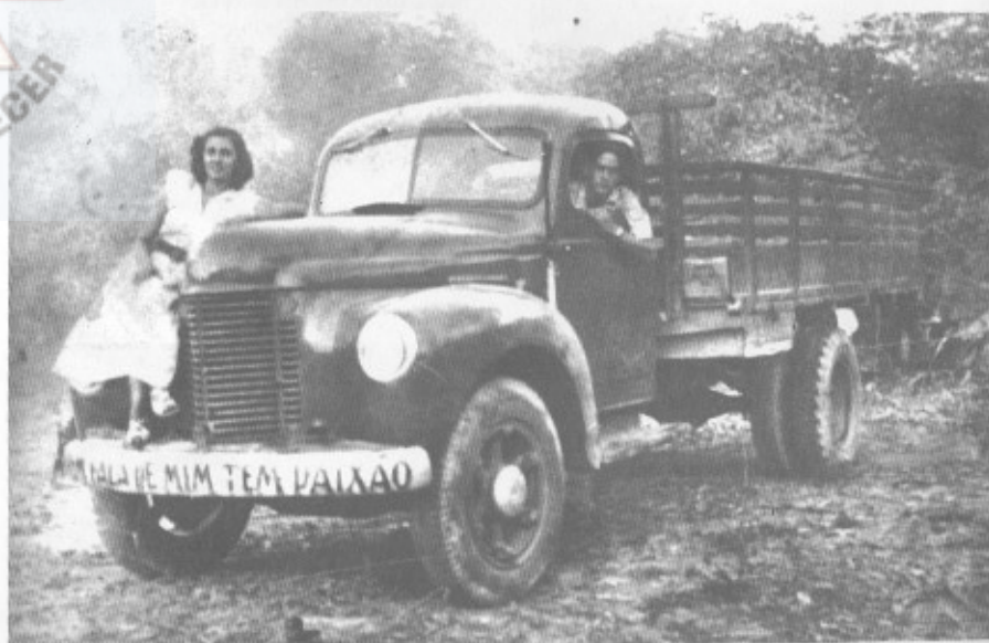
O Primeiro Caminhão adquirido.