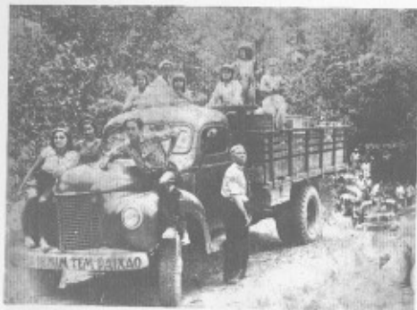
Em Caravana numa das muitas viagens.