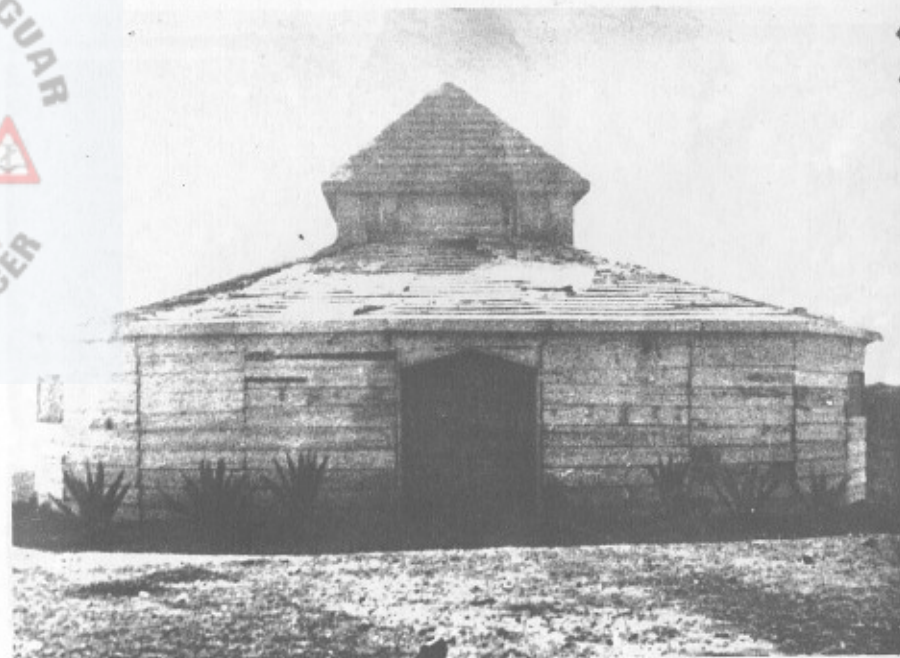
- O primeiro Templo - U.E.S.B. 1960/61.