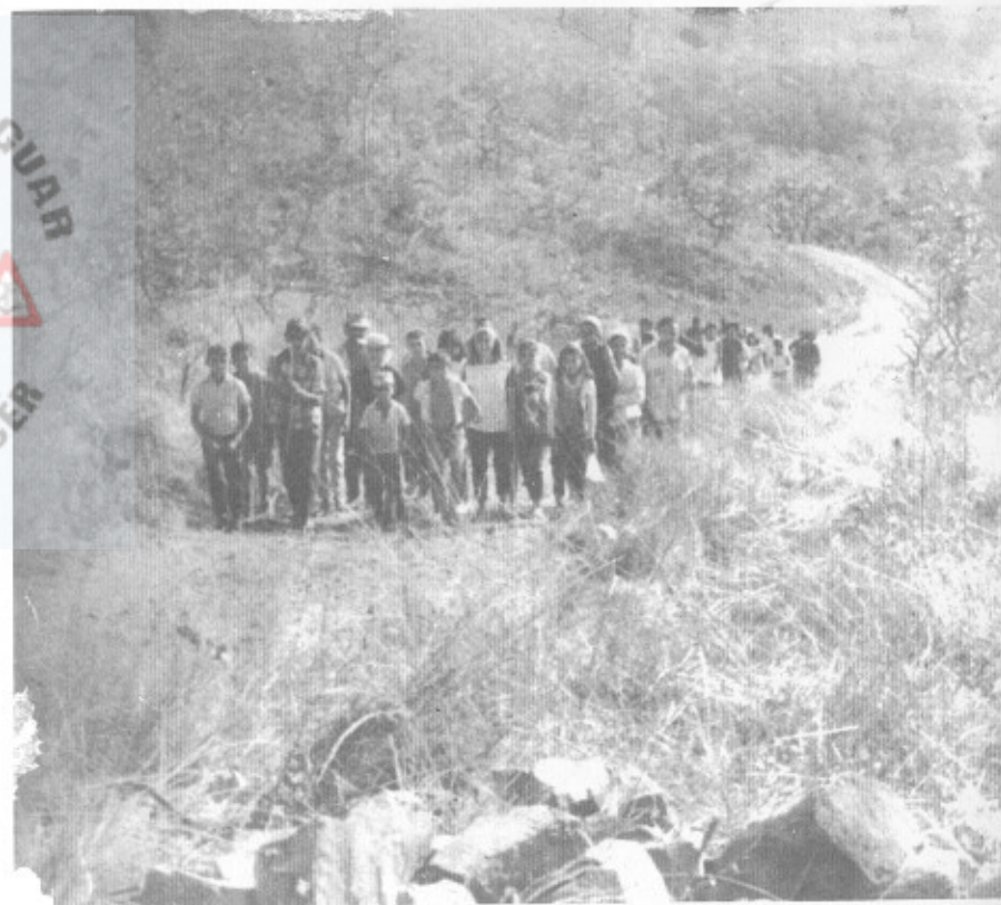
– VINDOS DA PLANTAÇÃO, NA SINTONIA DO ATENDIMENTO NO TEMPLO.