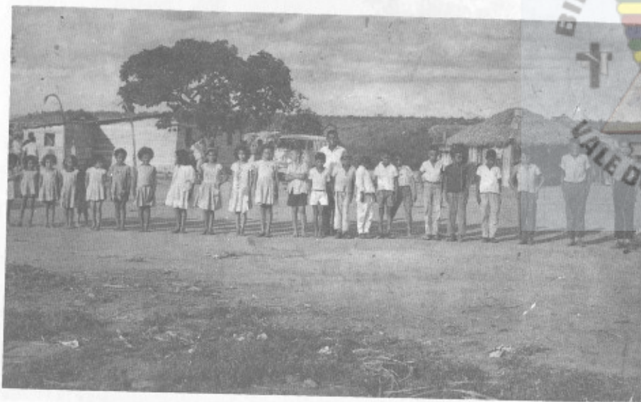
U.E.S.B. - 2 de novembro de 1963 - Crianças do Orfanato.

- Cria esperança e otimismo onde estiveres em favor dos outros, sem pedir remuneração. Auxilia muito, e espere pouco ou nada.