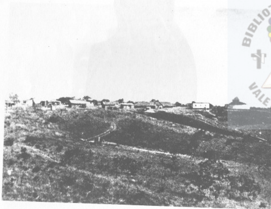
VISÃO PANORÂMICA DA U.E.S.B. A luta era imensa em todos os sentidos.

NÃO REPROVE A CONDUTA DOS OUTROS NÃO MALDIGA A POEIRA DA TERRA APROVEITE O SEU TEMPO EM APRENDER PORQUE É MUITO MAIS TARDE DO QUE PENSAS DEVES SENTIR A MAIS PERFEITA TOLERÂNCIA POR TODOS E UM INTERESSE COM SINCERIDADE PELAS CRENÇAS DOS QUE PERTENCEM A OUTRAS RELIGIÕES NÃO SE IMPORTE PELO QUE DEMONSTREM PELA TUA E PARA QUE POSSAS AJUDAR É PRECISO SE LIBERTAR DE FALSOS PRECONCEITOS.